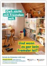
Plakat DIN A2 Motiv Kinderzimmer Artikelnr. 7S019