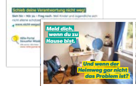
Postkarte Motiv Jugendzimmer Artikelnr. 7S023