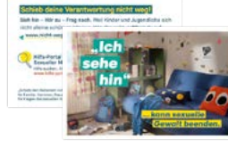
Visitenkarte Motiv Teenager Artikelnr. 7S057