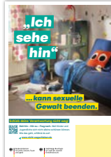
Plakat DIN A2 mit Logo-Eindruckfeld Artikelnr. 7S019

Als Download erhältlich: www.nicht-wegschieben.de