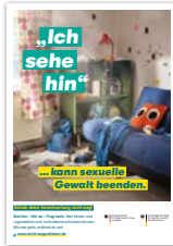
Plakat DIN A2 Motiv Teenager Artikelnr. 7S051