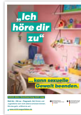
Plakat DIN A2 Motiv Schulkind Artikelnr. 7S050