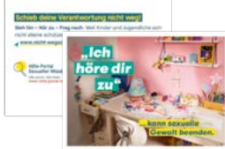
Postkarte Motiv Schulkind Artikelnr. 7S053