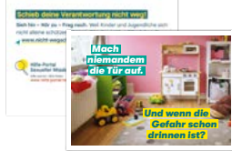
Postkarte Motiv Kinderzimmer rosa Artikelnr. 7S034