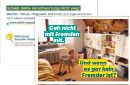
Postkarte Motiv Kinderzimmer Artikelnr. 7S024