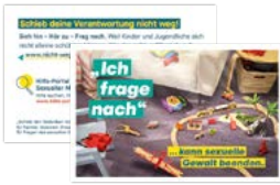
Visitenkarte Motiv Kitakind Artikelnr. 7S055