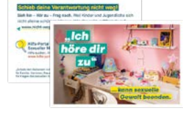
Visitenkarte Motiv Schulkind Artikelnr. 7S056