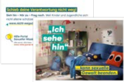
Postkarte Motiv Teenager Artikelnr. 7S054