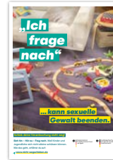
Plakat DIN A2 Motiv Kitakind Artikelnr. 7S049