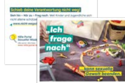
Postkarte Motiv Kitakind Artikelnr. 7S052